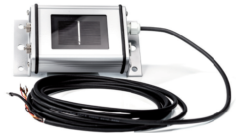
Sensor Box Professional Plus

Sensoren helfen bei der Erfassung von Abweichungen zwischen der möglichen und der tatsächlichen Stromproduktion und liefern wichtige Kennwerte in Bezug auf die Qualität der gesamten PV-Anlage. Besteht eine Abweichung zwischen dem Referenzwert und der tatsächlichen Produktion, wird eine Fehlermeldung generiert.